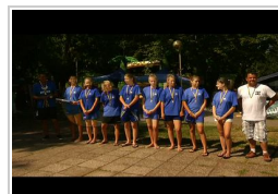
Legutóbb a tánc és a kézilabda mutatkozott be

Kezdőlap ▶ Egyéb ▶ Hétfvégén pálinkafesztivál Újszilváson!